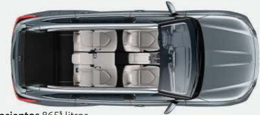
5 asientos 865 § litros