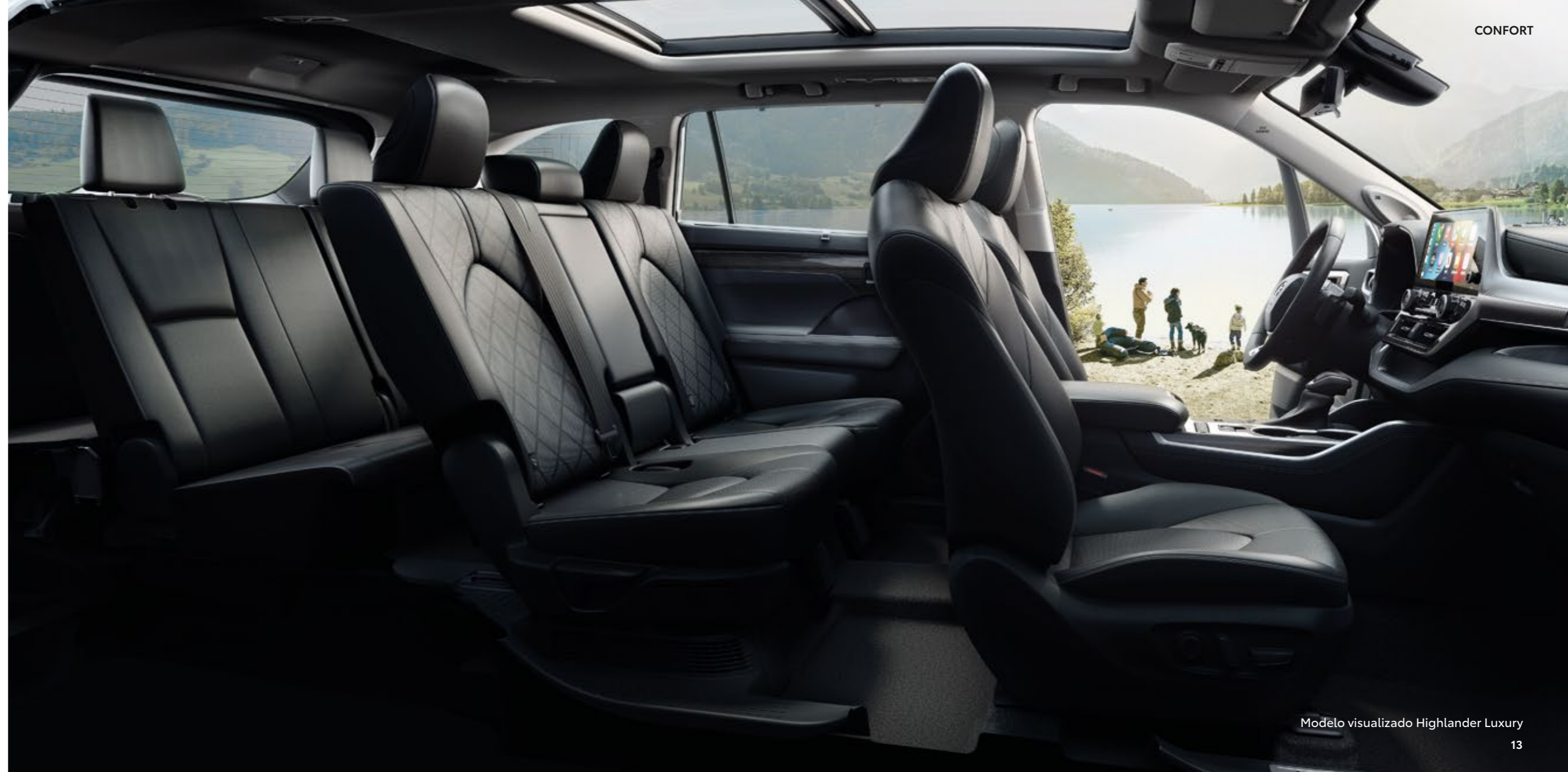
Modelo visualizado Highlander Luxury