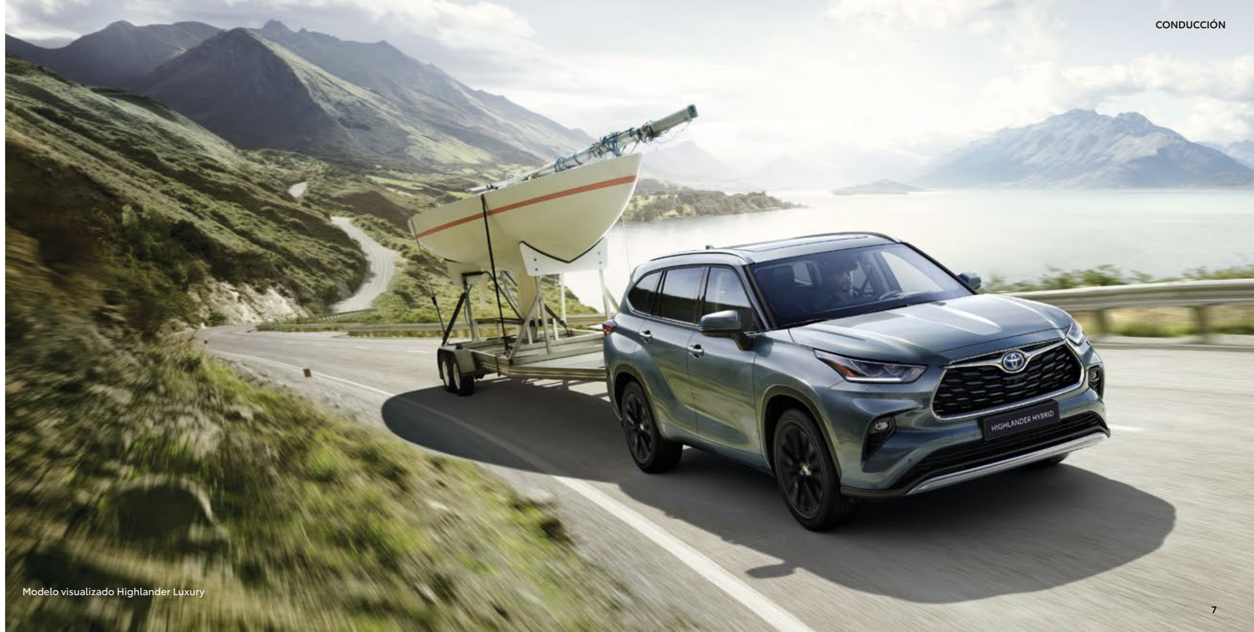
Modelo visualizado Highlander Luxury

El nuevo motor Hybrid Dynamic Force de 2,5 litros tiene potencia suficiente como para poder llevar un remolque de 2 toneladas y se combina con un sistema AWD-i que se activa automáticamente si es necesario; desde tirar de un remolque cuando el vehículo está parado, hasta viajar en condiciones de poco agarre como el hielo y la nieve. Al activar el motor eléctrico trasero adicional, independiente del principal, se distribuye una fuerza propulsora adicional a las ruedas traseras, suprimiendo el deslizamiento de las ruedas delanteras. También permite reducir el subviraje, lo que ayuda al Highlander a deslizarse con total confianza en las curvas.