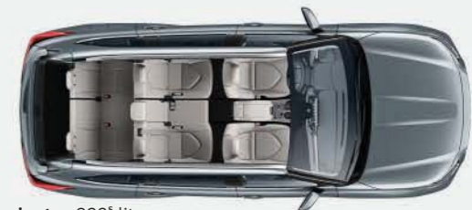
7 asientos 322 § litros

Espacio bajo demanda Independientemente de tus necesidades, donde quiera que vayas, el Highlander ofrece una amplia variedad de configuraciones de asientos.