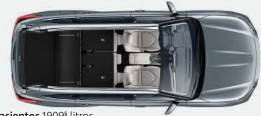
2 asientos 1909 § litros